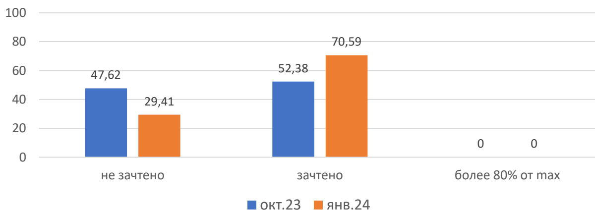
Рисунок 1. Основные результаты ДР по биологии

На рисунке 1 представлены основные результаты ДР по биологии в МСУ. В октябре 2023, январе 2024 г. в МСУ не было участников, набравших максимальный балл.